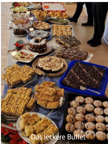
Das leckere Buffet