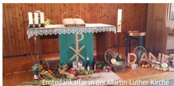
Erntedankaltar in der Martin-Luther-Kirche

Herzlichen Dank für alle Gaben, mit denen wir zu Erntedank unsere Altäre schmücken konnten. Die Gaben aus der Martin-Luther-Kirche Tegernheim wanderten nach St. Lukas und dann weiter zur Tafel Regensburg, wo die Spende mit Freude angenommen wurde!